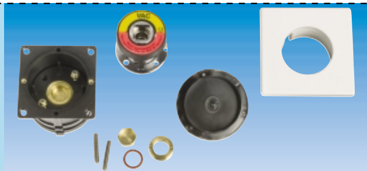
Prise DIN encastrée