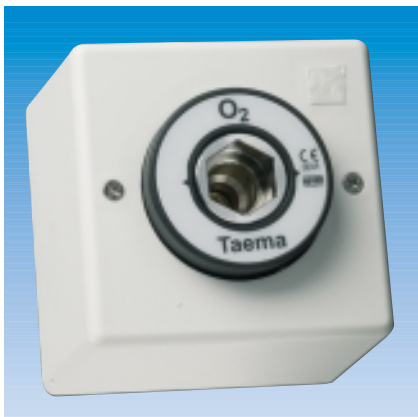
Prise DIN O 2 en saillie

Prise murale au standard allemand (DIN) pour fluides médicaux conçue pour effectuer des branchements rapides sans aucun risque d'intervention des fluides. Elle est également équipée d'une position « parking ».